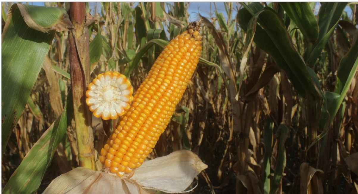
Lote de maíz tardío con potencial de rinde intermedio. Carlos Tejedor, Bs. As. (24-04-23).

Hacia el Oeste de Buenos Aires-Norte de La Pampa la recolección brinda rindes por debajo de los promedios de las últimas campañas, pero aún siguen siendo los más altos del país a la fecha. En los Núcleos Norte y Sur gran parte de los cuadros tardíos y de segunda ocupación se encuentran en madurez fisiológica.