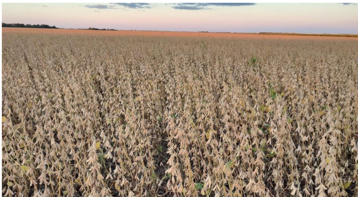
Lote de soja de primera terminando ciclo. Localidad: Pozo del Toba, Santiago del Estero.

Asimismo, se inició la cosecha de soja de segunda en ambos núcleos, registrando pérdidas de área cosechable del 60%. El 40,3 % del área apta de soja de segunda se encuentra en madurez fisiológica.