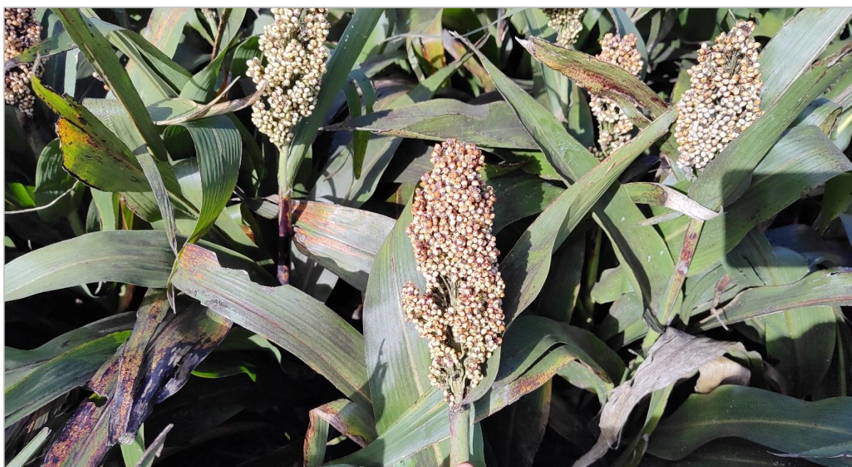
Lote de sorgo granífero culminando el llenado de granos. Saladillo, Bs. As. (21-04-23).

Sobre la región del Centro-Norte de Santa Fe, ya se logró recolectar el 50 % del área apta arrojando un rinde medio parcial de 31,6 qq/Ha. Hacia la zona Centro-Este de Entre Ríos las labores se concentran sobre los planteos tempranos del cereal. En las zonas Cuenca del Salado y el Centro de Buenos Aires heladas puntuales afectaron a los lotes más demorados.