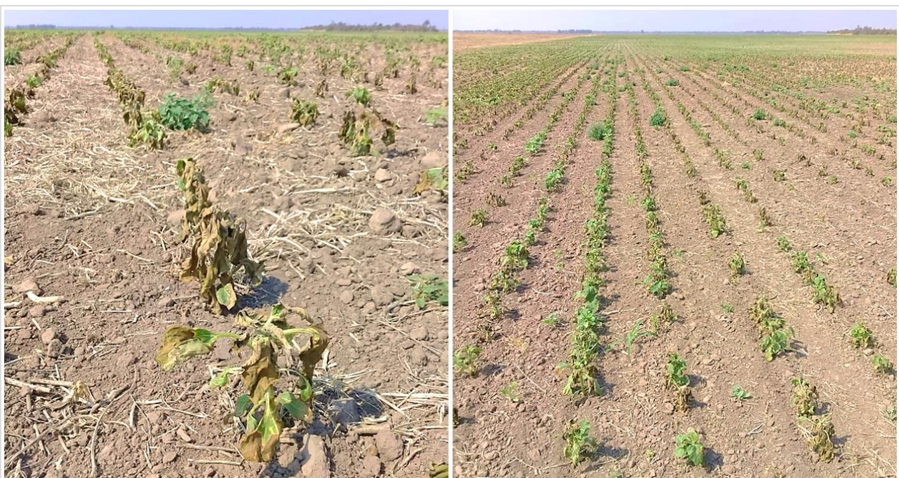
Lote de girasol en expansión de hojas, afectado por heladas. Avia Terai, Chaco (01-09-20).

Por otro lado, la situación en el Centro-Norte de Santa Fe se proyecta diferente. El frente de tormenta ha alcanzado buena parte del área y los registros posteriores a la elaboración de este informe continúan mostrando lluvias para esa zona. Se espera que en el transcurso de la próxima semana se retome la de siembra y se impulse el crecimiento de los lotes ya implantados y emergidos.