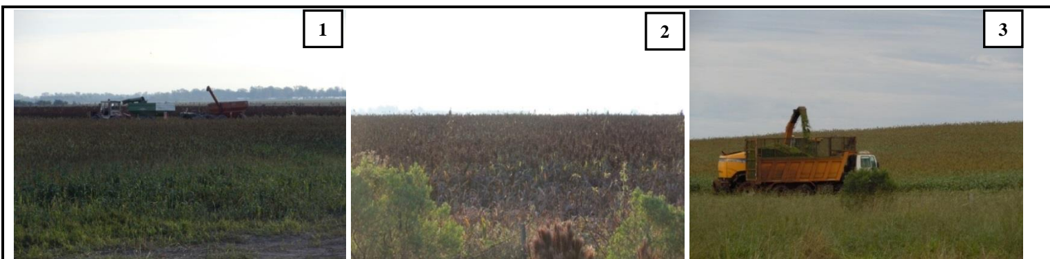
1) Lote de sorgo granífero siendo trillado sobre la ruta 118, en cercanías de San Miguel, Corrientes (10/06/13). 2) Lote de Sorgo en madurez fisiológica. Loreto, Corrientes (10/06/13). 3) Lote de Sorgo doble propósito, siendo picado en planta entera. Posadas, Misiones (14/06/13).