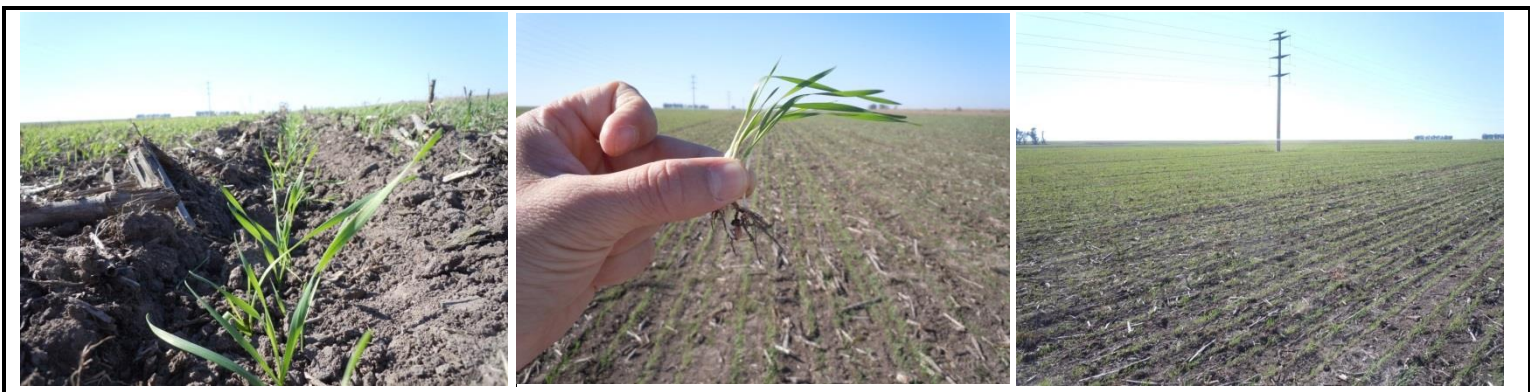
Trigo sobre rastrojo de maíz expandiendo la segunda hoja. Ruta 123, Mercedes, Corrientes (12/06/13).