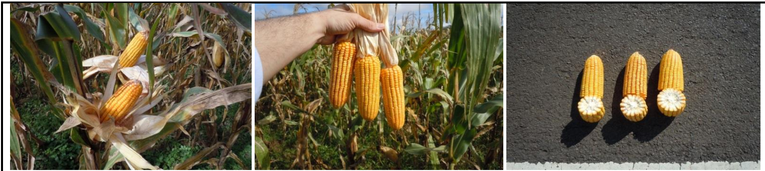
Lote de maíz y espigas en grano duro, comenzando a entregarse para cosecha. Presentaba 16 hileras por espiga, en general bien formadas. Loreto, Corrientes (03/06/13).